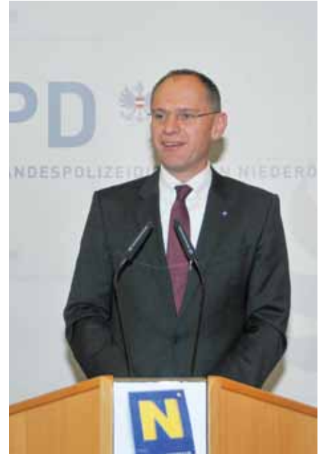
Mag. Gerhard Karner bei seiner Festrede.

Er bedankte sich bei den Polizistinnen und Polizisten für die über Jahrzehnte erbrachte Leistung im Dienste der Bevölkerung. Den jungen Kolleginnen und Kollegen, die mit Wirksamkeit von 1. Dezember 2013 in das öffentlich rechtliche Dienstverhältnis übernommen werden, wünschte er viel Freude und Erfolg in ihrer künftigen verantwortungsvollen Tätigkeit. Darüber hinaus wünschte Karner allen Anwesenden