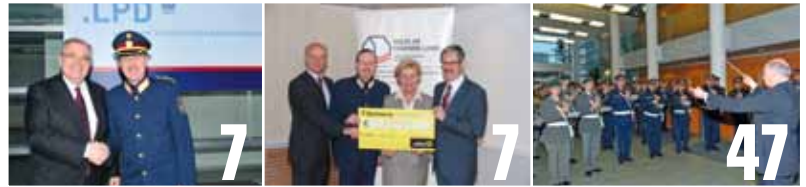
Justizminister Wolfgang Brandstetter besucht LPD NÖ