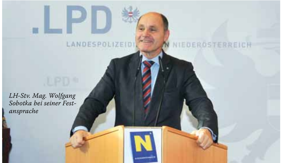
LH-Stv. Mag. Wolfgang Sobotka bei seiner Festansprache

In Vertretung von Landeshauptmann Dr. Erwin Pröll bedankte sich LH-Stv. Mag. Wolfgang Sobotka in seiner Ansprache für die gezeigten Leistungen der geehrten Bediensteten. Er richtete auch einen besonderen Dank an jene Beamten, die nun ihren Ruhestand antreten, „denn sie haben durch ihre hervorragende Tätigkeit die Sicherheit in Niederösterreich mitgestaltet. Und sie haben die nächste Generation der Polizisten für ihre verantwortungsvolle Arbeit vorbereitet. Niederösterreich ist deshalb