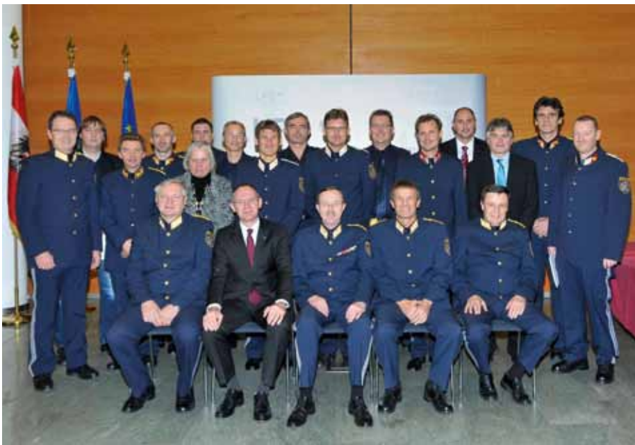
Gruppenbild der Geehrten Kollegen der LPD NÖ.