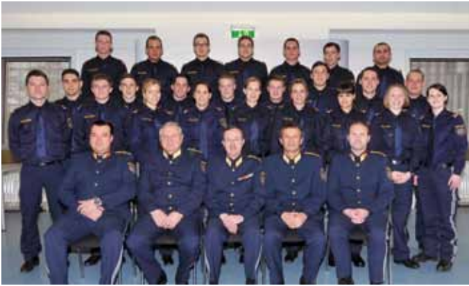
Kollegenschaft des Grundausbildungslehrganges N-PGA 33-11

12 Frauen und 40 Männer absolvierten erfolgreich die Polizeigrundausbildung und verstärken seit dem 1. Jänner 2014 die Polizei in Niederösterreich.