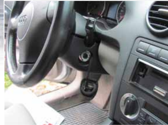
Beschädigungen an sichergestellten KFZ

Bei ihrer Festnahme hatten die Beschuldigten professionelles Einbruchswerkzeug bei sich, welches ausschließlich bei KFZ-Diebstählen zur Anwendung kommt. Nach ihrer Vernehmung, in der der 45-jährige