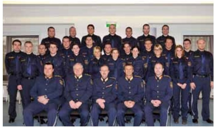
Kollegenschaft des Grundausbildungslehrganges N-PGA 34-11

S ie werden zukünftig in den verschiedensten Bezirken sowie in den Städten Wr. Neustadt und Schwechat und bei der Landesverkehrsabteilung ihren Dienst verrichten.