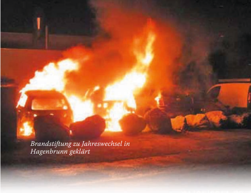
Brandstiftung zu Jahreswechsel in Hagenbrunn geklärt